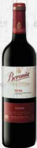
BERONIA CRIANZA Rioja

IF YOU PREFER, FOR € 6 MORE, YOU CAN CHANGE IT FOR THESE WINES OF EXCELLENT QUALITY: