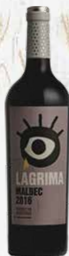
LÁGRIMA MALBEC Argentina